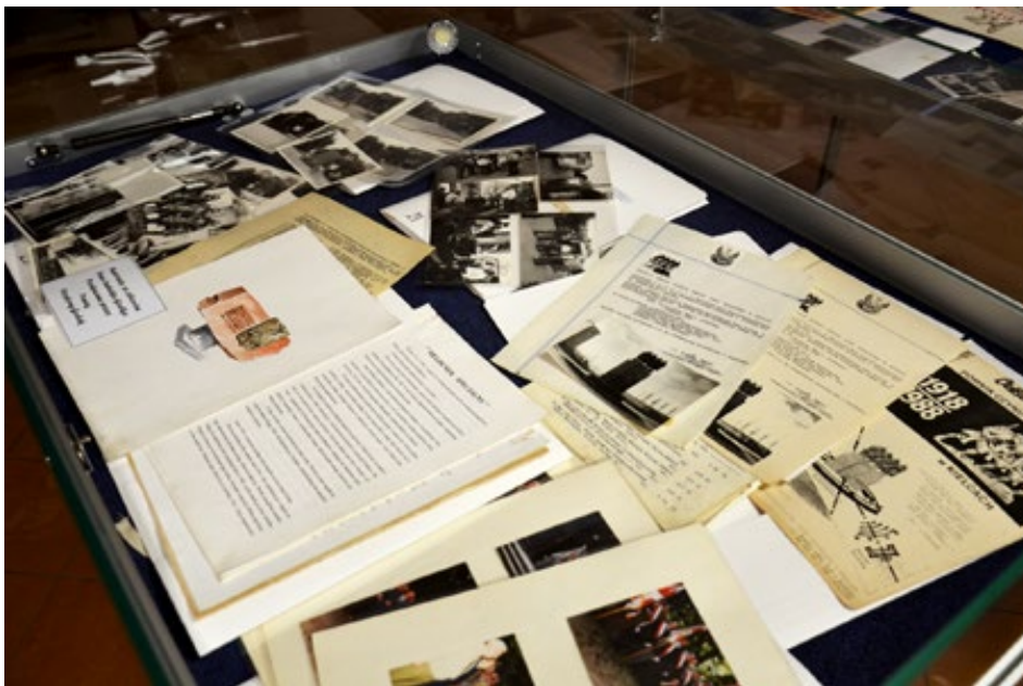
7-8. Wystawa zbiorów darczyńców Archiwum Państwowego w Kielcach