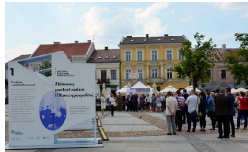
1. Uroczyste otwarcie wystawy Archiwa Rodzinne Niepodległej. Zbiorowy portret rodzin II Rzeczypospolitej

Międzynarodowy Dzień Archiwów – wernisaż wystawy Archiwa Rodzinne Niepodległej. Zbiorowy portret rodzin II Rzeczypospolitej , Kielce, 9 czerwca 2022 roku