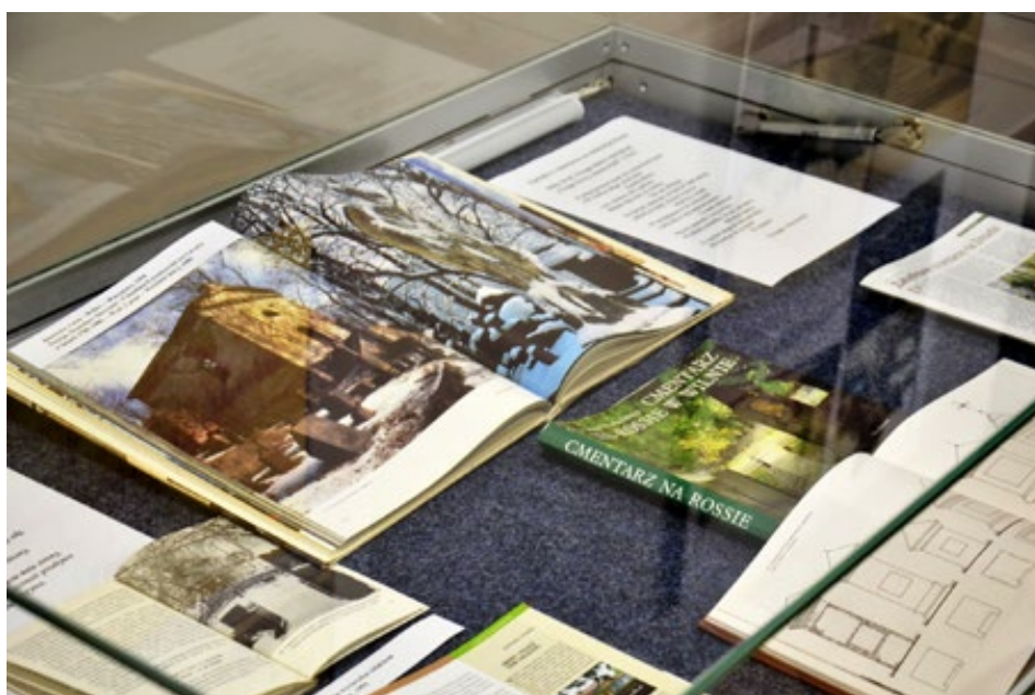
68. Wystawa Nie tylko na wileńskiej Rossie... ze zbiorów Pedagogicznej Biblioteki Wojewódzkiej w Kielcach