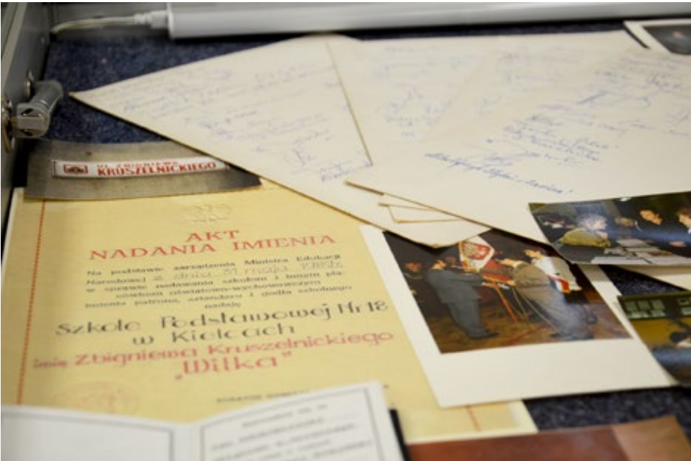
23. Fragment wystawy Zbigniew Kruszelnicki „Wilki” i jego oddział „Wilków” – pamiątki w Izbie Pamięci Szkoły Podstawowej nr 18 w Kielcach