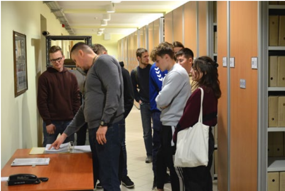
3. Uczniowie z Zespołu Szkół Informatycznych im. Gen. J. Hauke-Bosaka w Kielcach podczas zwiedzania magazynów archiwalnych, 5 kwietnia 2022 r.