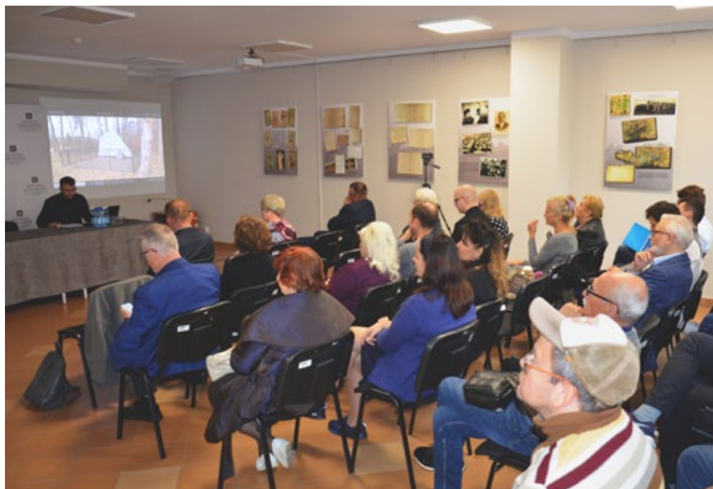
48. Zgromadzeni goście