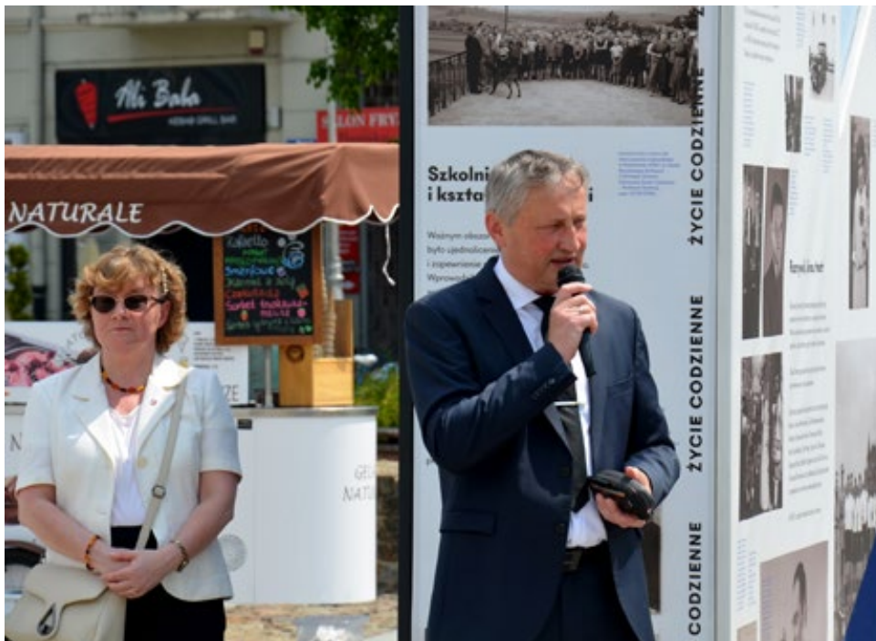
4. Zbigniew Koniusz Wojewoda Świętokrzyski podczas przemówienia