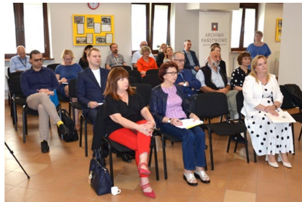
42. Uczestnicy konferencji