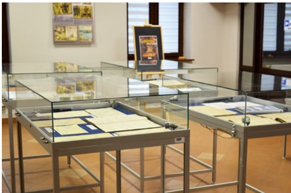
67. Wystawa ...los po obcych ziemiach siał... przygotowana przez Archiwum Państwowe w Kielcach