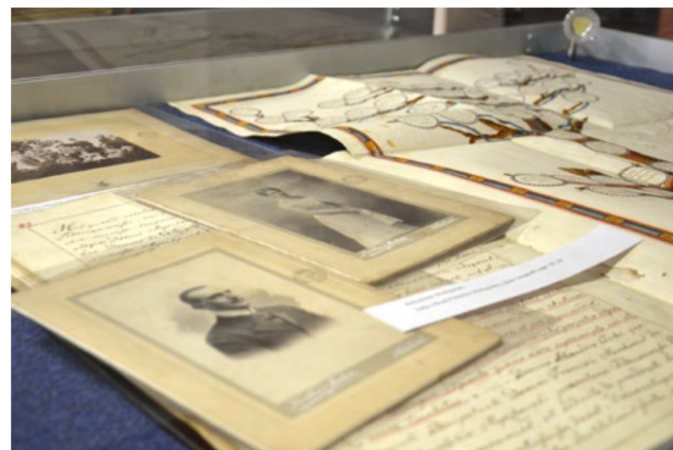
54. Fragment wystawy Skąd pochodzimy – nasze korzenie – materiały archiwalne z zasobu Archiwum Państwowego w Kielcach przygotowanej przez Agnieszkę Jardel z Archiwum Państwowego w Kielcach