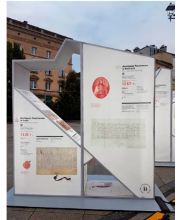
1. Na wystawie znalazł się również najstarszy dokument z zasobu Archiwum Państwowego w Kielcach, datowany na 1357 r.