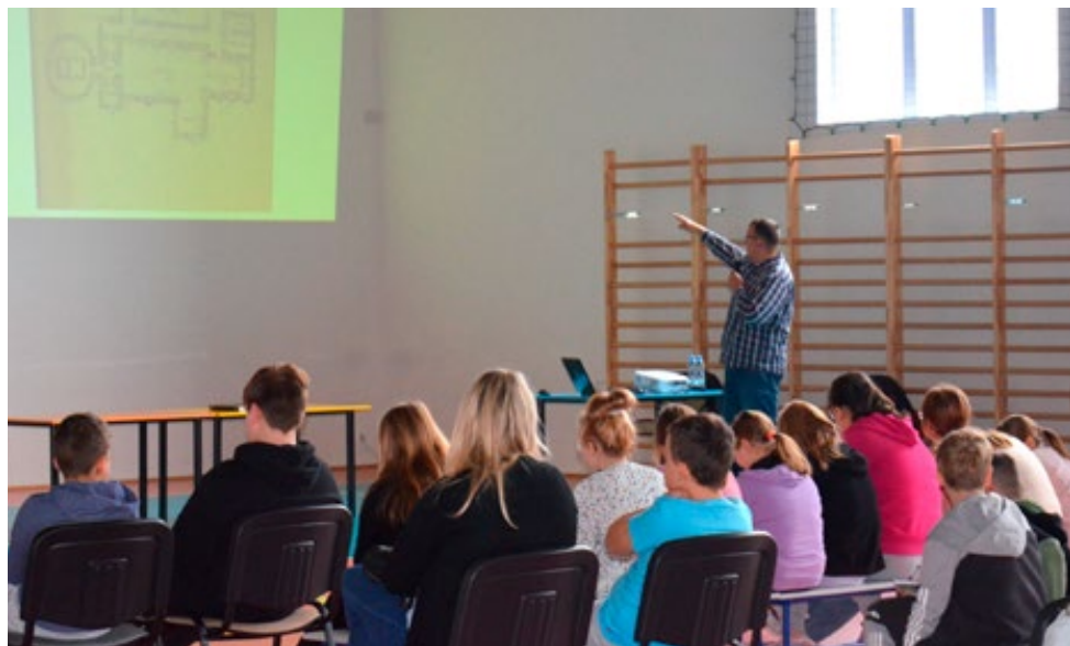
8. Lekcja archiwalna prowadzona w Szkole Podstawowej im. Jana Pawła II w Piotrkowicach, 23 listopada 2022 r.