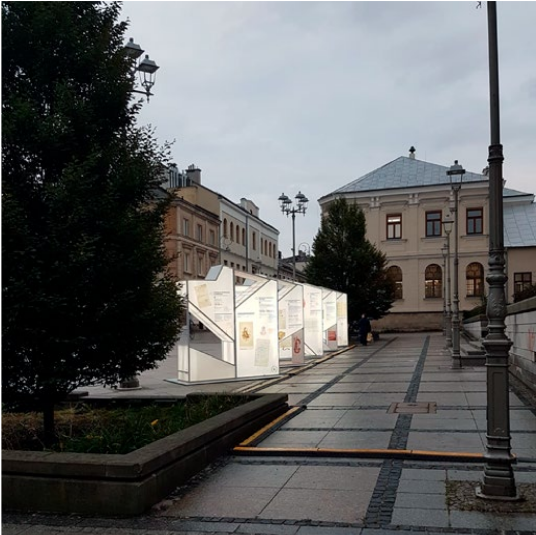
3. Wystawa dostępna była również po zmroku dzięki możliwości jej podświetlenia

Promocja książki Z dziejów gminy Łoniów w Gminnym Ośrodku Kultury w Łoniowie, 23 września 2022 roku