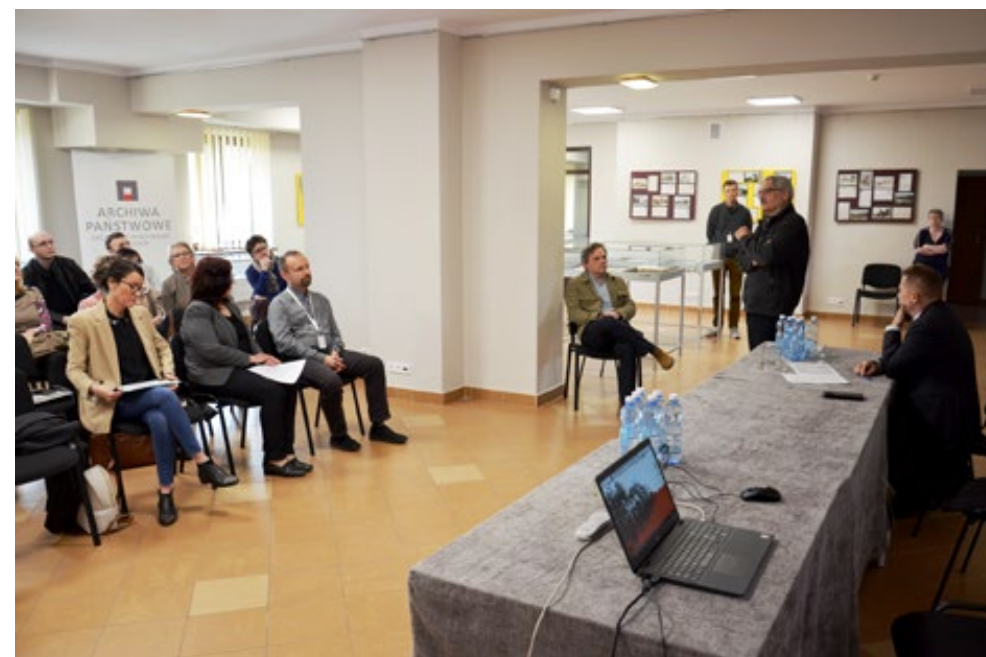
21. Dyskusje po prelekcjach