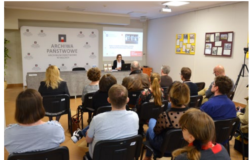
29. Goście Spotkania