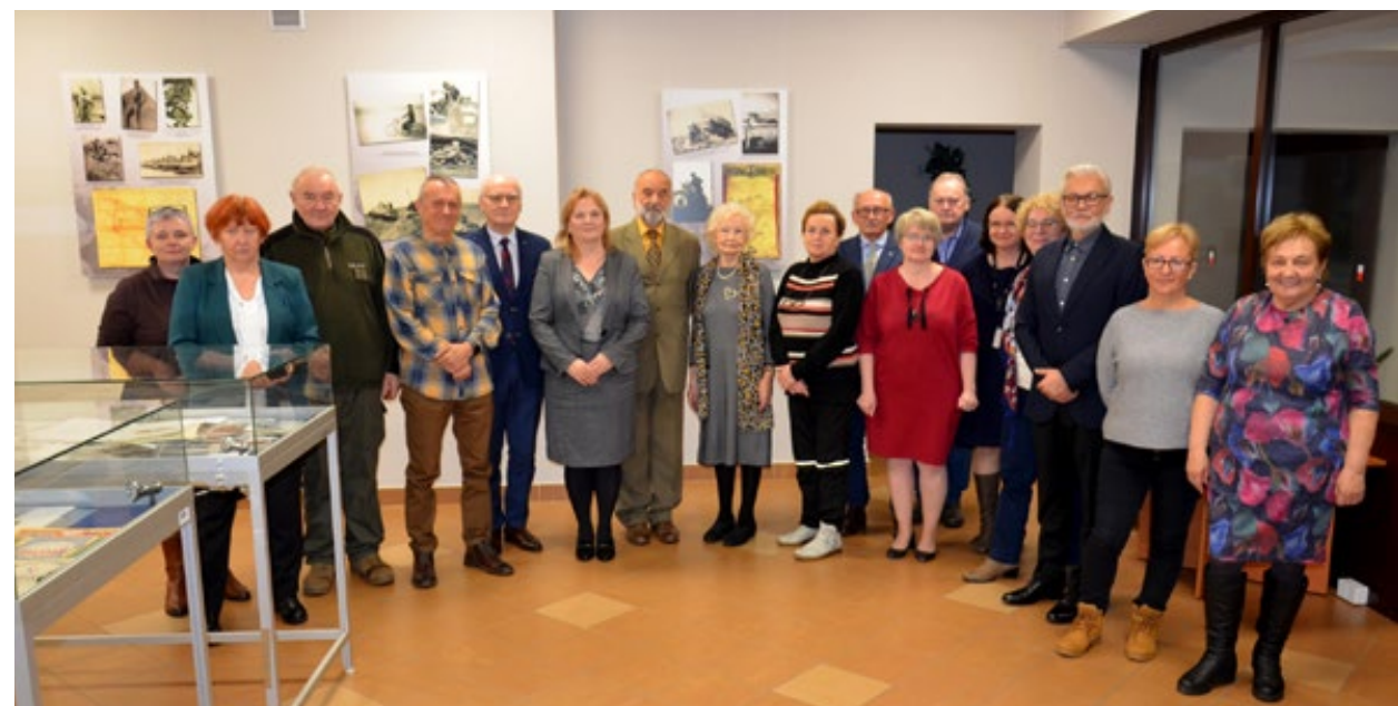
6. Zdjęcie pamiątkowe z darczyńcami Archiwum Państwowego w Kielcach