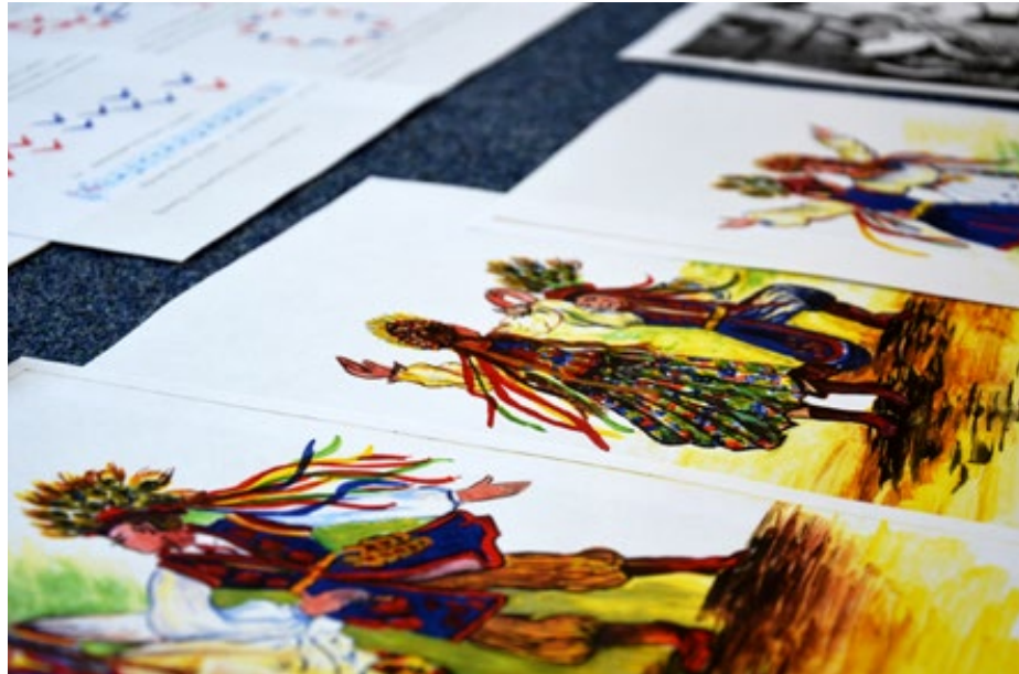
31–32. Wystawa Kukuleczka kuka, chłopiec panny szuka... Materiały archiwalne dotyczące tańca w zasobie Archiwum Państwowego w Kielcach