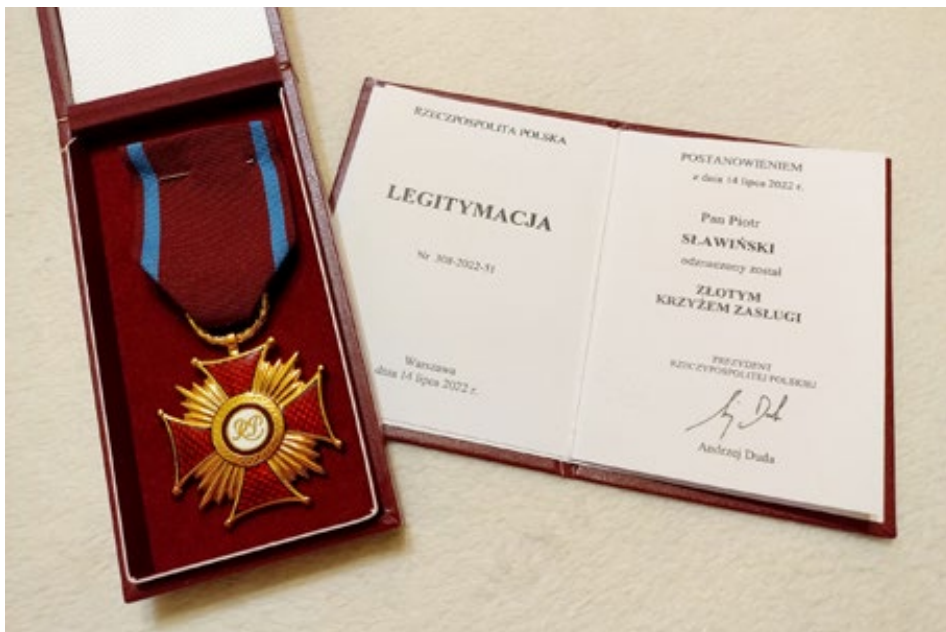
4. Medal i legitymacja