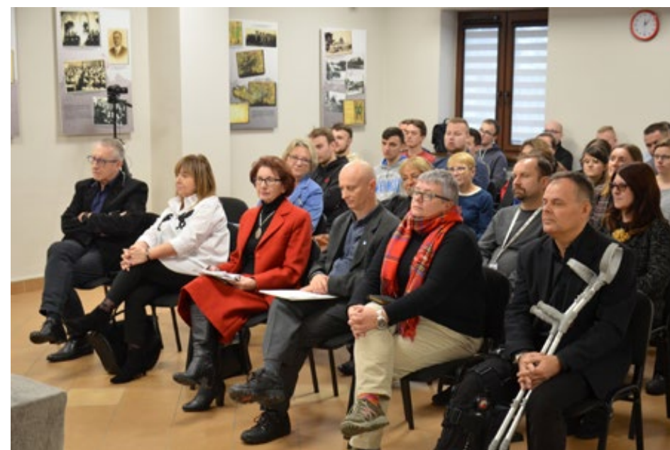
66. Goście Spotkania