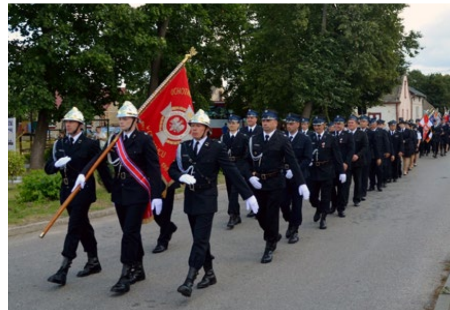
1. Defilada członków Ochotniczej Straży Pożarnej podczas uroczystości w Grabowcu

Uroczystość z okazji 100 rocznicy założenia Ochotniczej Straży Pożarnej w Grabowcu pow. Hża, Grabowiec, 17 sierpnia 2022 roku