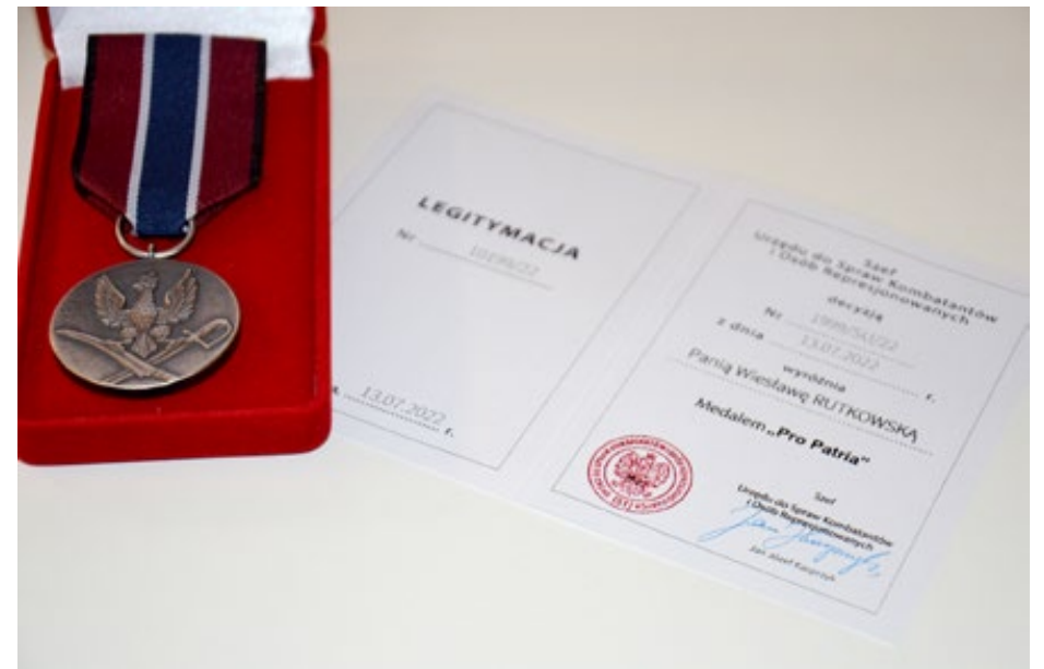
2. Medal i legitymacja