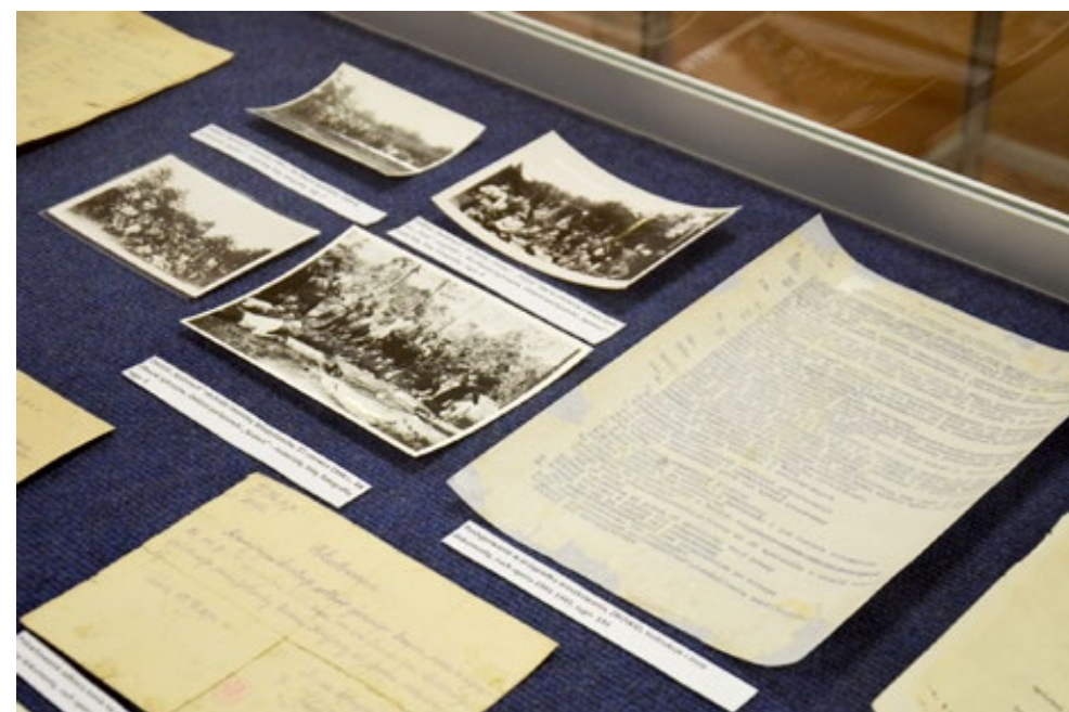
22. Fragment wystawy Do wolnej Polski nam powrócić daj... Armia Krajowa w dokumencie archiwalnym przygotowanej przez Konrada Maja, Waldemara Chamalę z Archiwum Państwowego w Kielcach