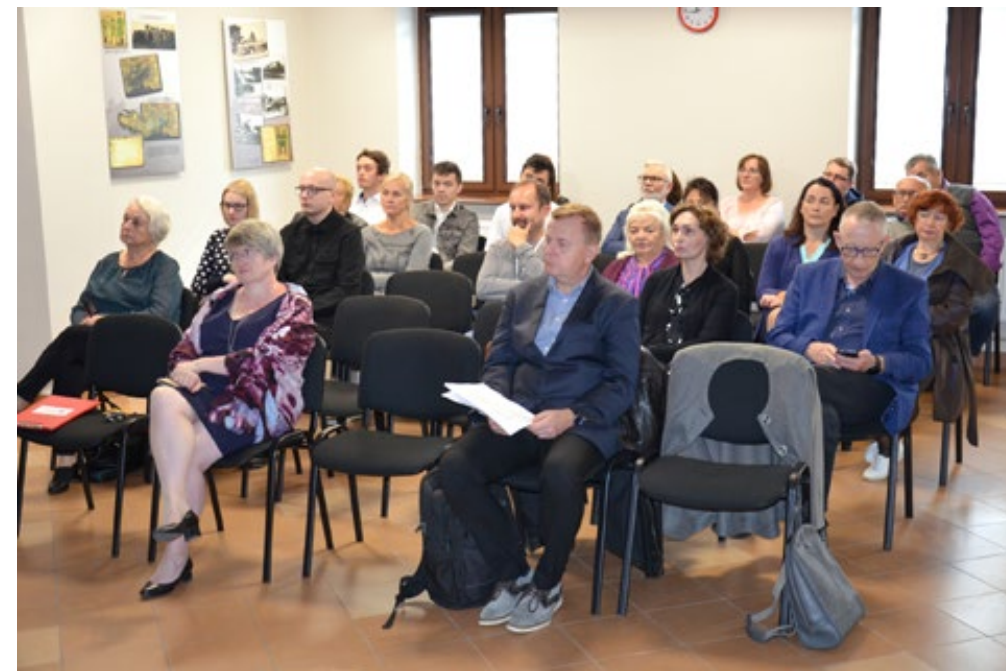
49. Zgromadzeni goście