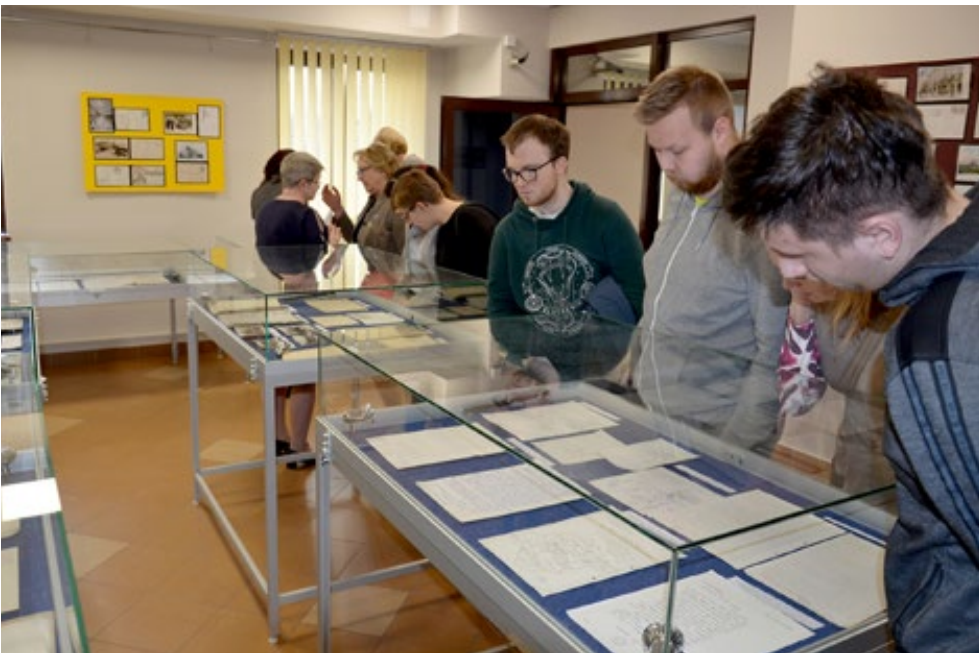
24. Dyskusje w kularach i zwiedzanie wystaw

Taniec w źródle archiwalnym, Kielce, 25 maja 2022 roku