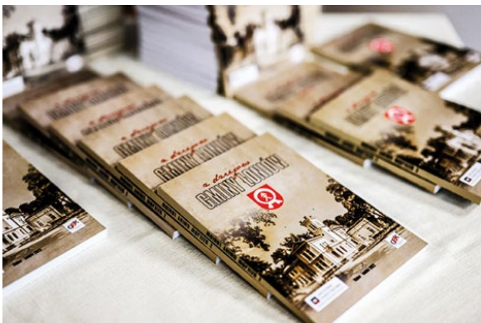
4. Promocja książki Z dziejów gminy Łonów

Ogłoszenie wyników Konkursu na wspomnienia i opracowania historyczno-literackie dotyczące terenu działania Ochotniczej Straży Pożarnej w Sulisławicach w remizie Ochotniczej Straży Pożarnej w Sulisławicach, 9 października 2022 roku