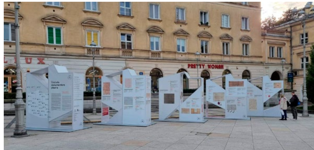
2. Wystawa Sieci Archiwów Państwowych Historia dokumentem pisana prezentowana na Placu Literatów w Kielcach