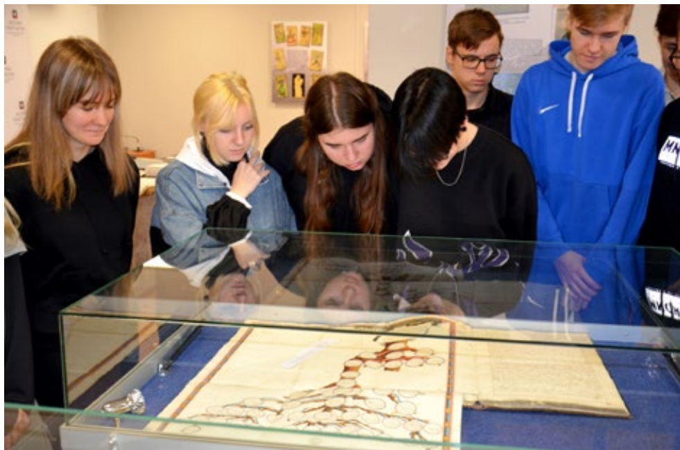
7. Uczniowie z Zespołu Szkół Przemysłu Spożywczego w Kielcach podczas oglądania wystawy, 28 października 2022 r.