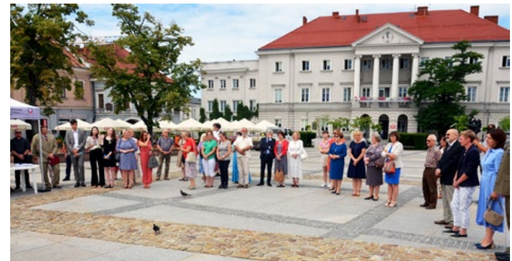
2. Uczestnicy wernisażu