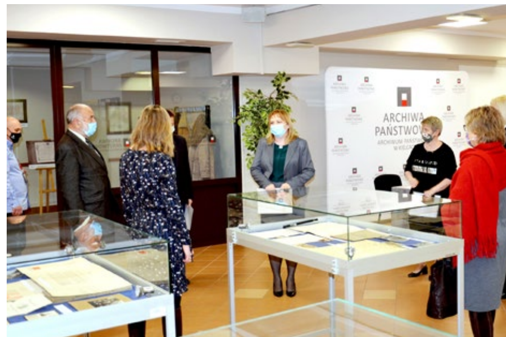
9. Dyskusja przy wystawie Urzędy i urzędnicy w dokumencie archiwalnym – przygotowanej przez Łukasza Guldona i Iwonę Pogorzelską z Archiwum Państwowego w Kielcach