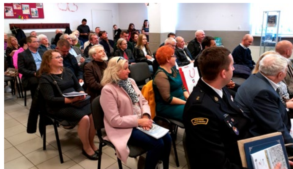
2. Goście, laureaci i uczestnicy Konkursu