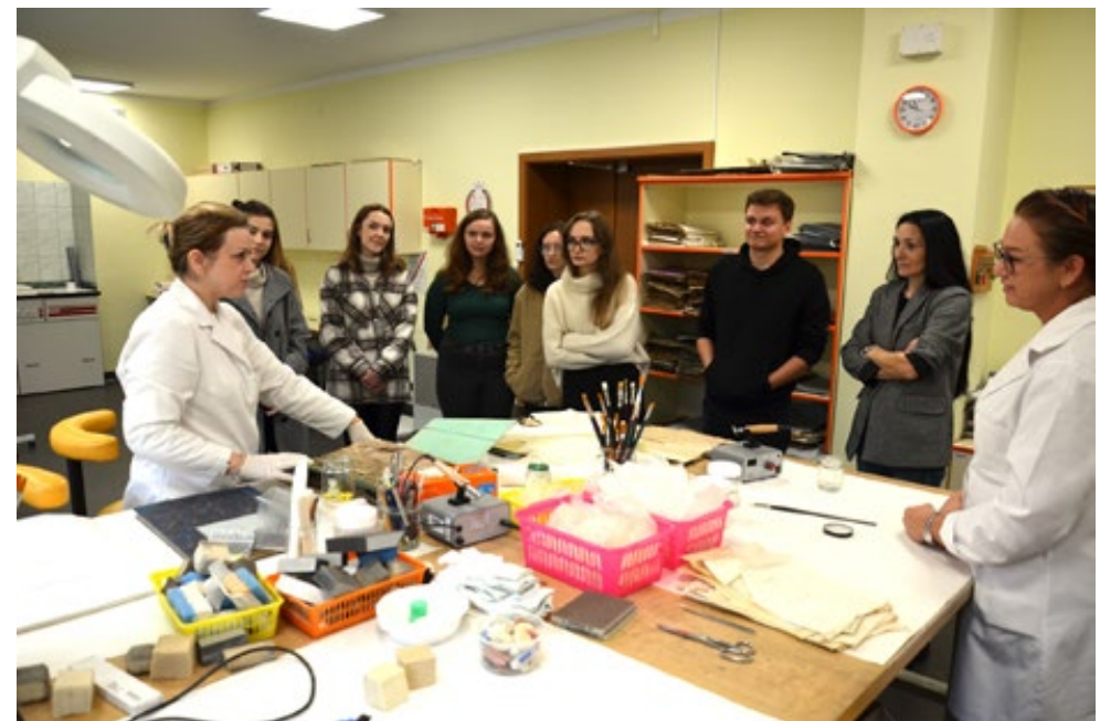
6. Studenci dziennikarstwa i komunikacji społecznej Uniwersytetu Jana Kochanowskiego w Kielcach podczas zwiedzania pracowni konserwacji, 21 października 2022 r.