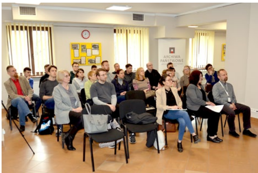
20. Goście Spotkania