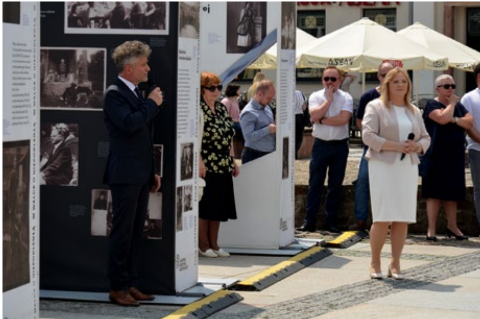
3. Krzysztof Słoń Senator RP w trakcie przemówienia

Wernisaż wystawy Mamo, ja nie chcę wojny! 1939–45 Polska / 2022 Ukraina , Kielce, 17 lipca 2022 roku