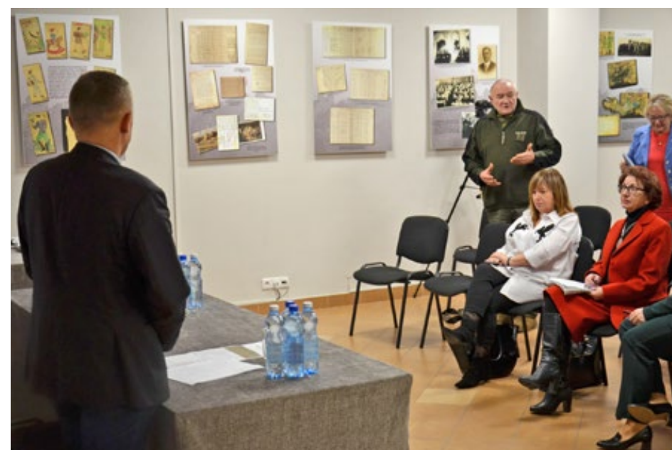
65. Dyskusja po prelekcjach