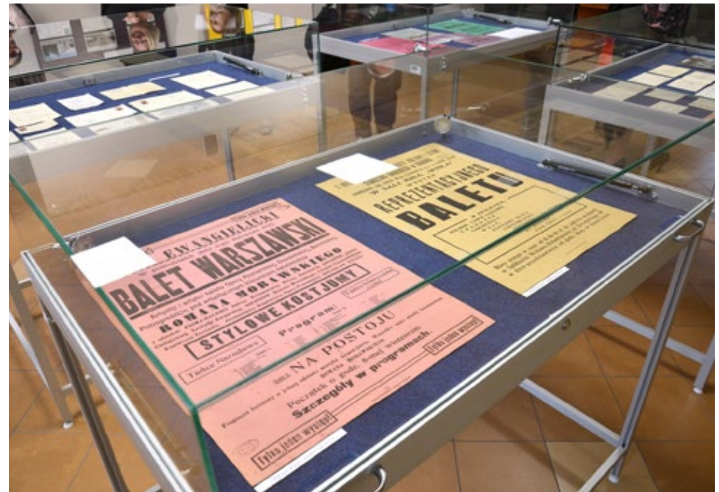
30. Wystawa Kukuleczka kuka, chłopiec panny szuka... Materiały archiwalne dotyczące tańca w zasobie Archiwum Państwowego w Kielcach przygotowana przez Paulinę Kaletę z Archiwum Państwowego w Kielcach