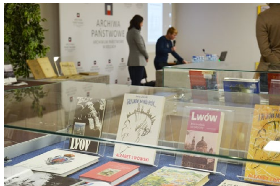
64. Fragment wystawy książek o Lwowie przygotowanej przez Pedagogiczną Bibliotekę Wojewódzką w Kielcach