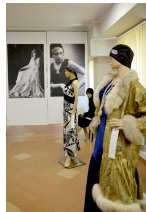
5-6. Wystawa „Moda Niepodległej”