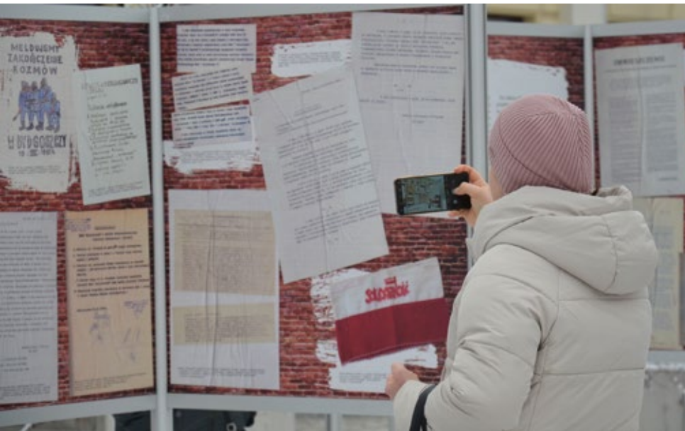
4. Zwiedzanie wystawy