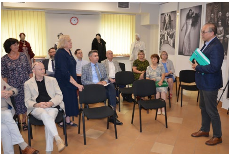
25. Dyskusja po pierwszej części konferencji