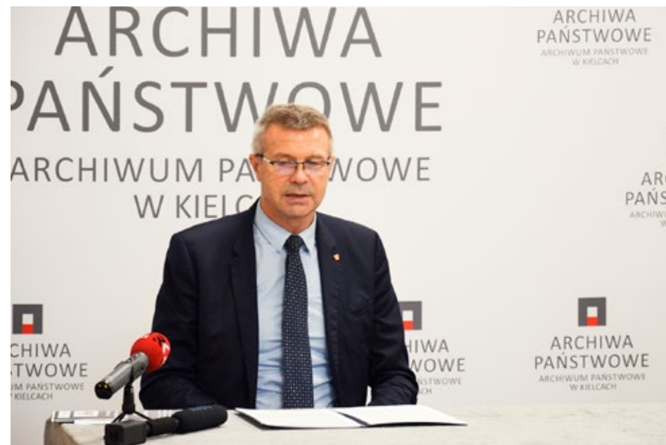
3. Bogdan Wenta – Prezydent Miasta Kielce podczas swojego wystąpienia