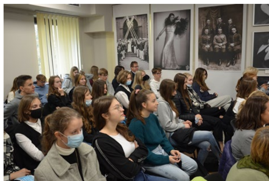
53. Zgromadzeni goście podczas obrad