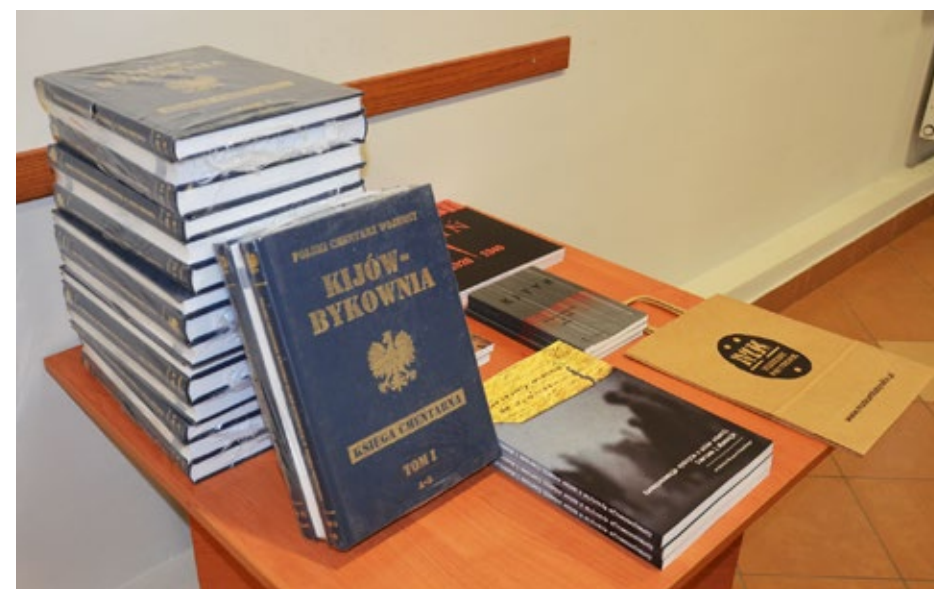
35. Publikacje Muzeum Katyńskiego