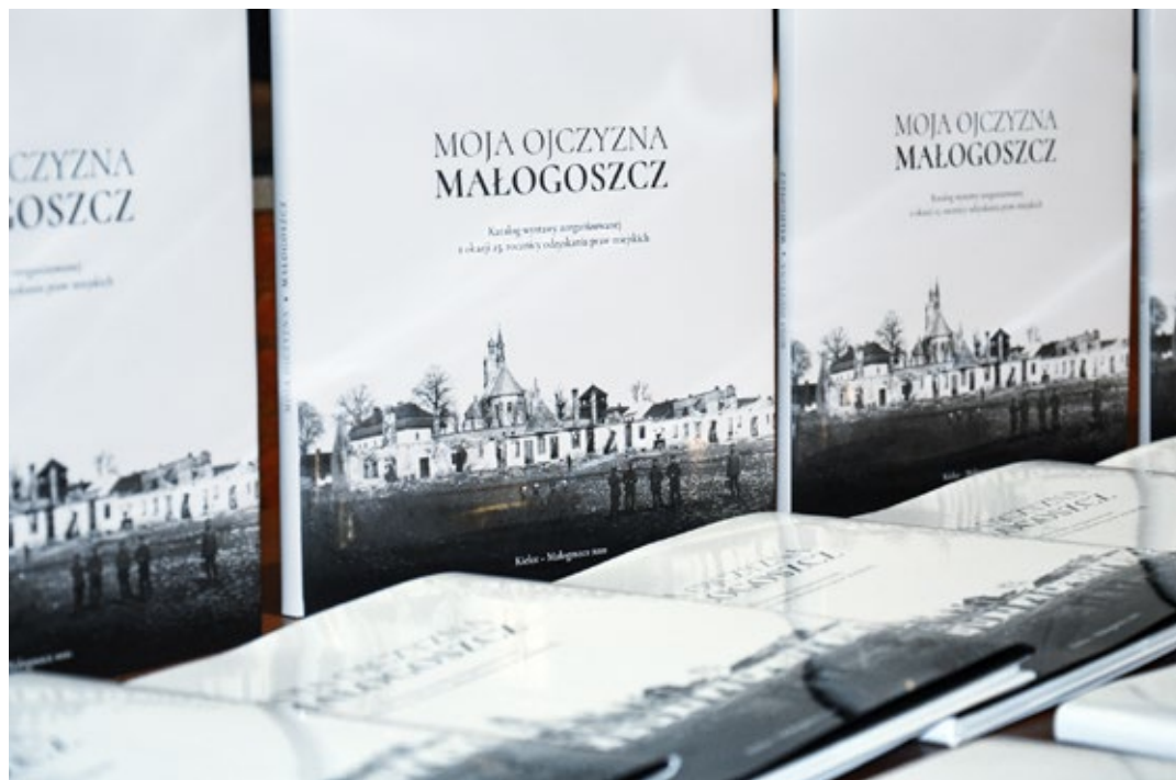
7. Promocja katalogu wystawy „Moja Ojczyzna Małogoszcz”

Konferencja „Łaszczyńscy. Miedzianka” w Muzealnej Izbie Górnictwa Kruszcowego w Miedziance, 20 września 2021 roku