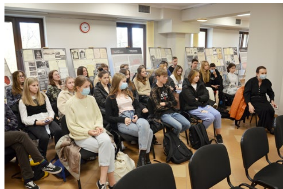
4. Młodzież z I Liceum im. Stefana Żeromskiego w Kielcach