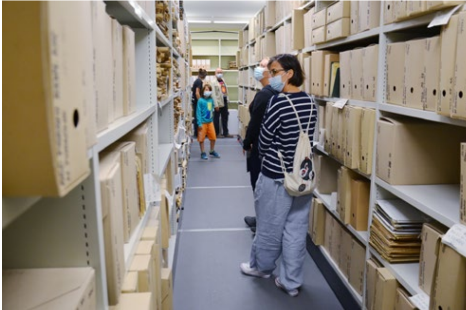
7. Zwiedzanie magazynów było dodatkową atrakcją MDA