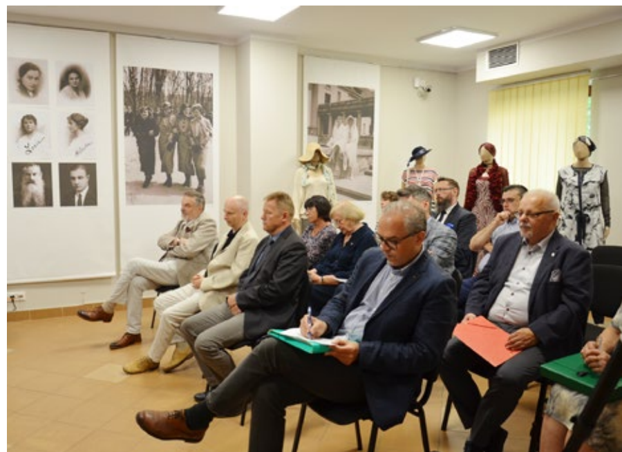
18. Zaproszeni prelegenci