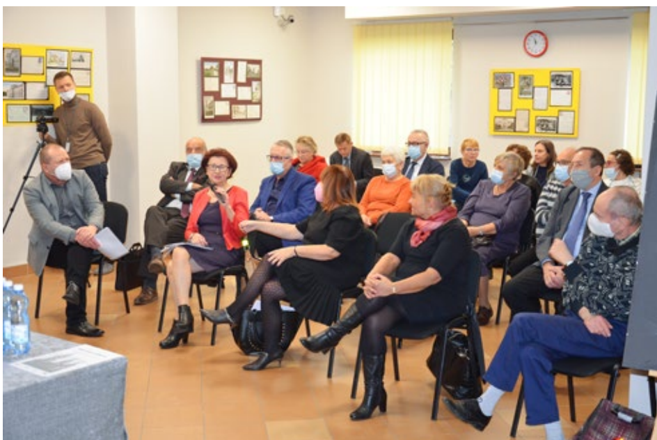
70. Dyskusja po zakończeniu części pierwszej