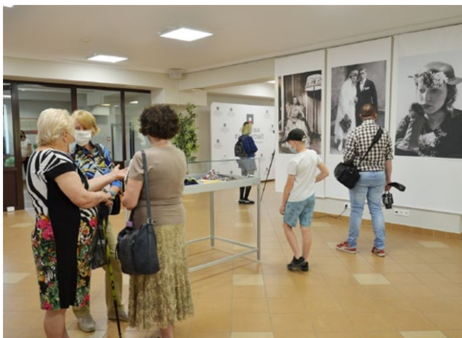
4. Wystawa „Moda Niepodległej”