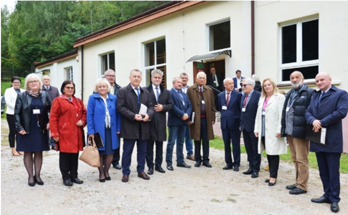
7. Fotografia pamiątkowa organizatorów i uczestników konferencji