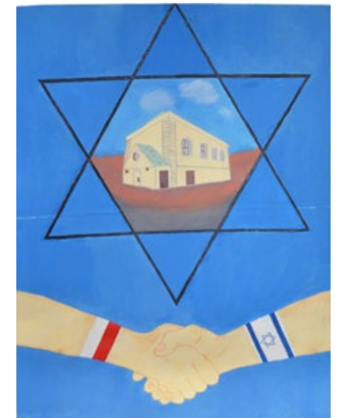
47-49. Prace nagrodzone w ogólnopolskim konkursie tematycznym „Nasi sąsiedzi – Żydzi”, edycja IX z 2021 r.