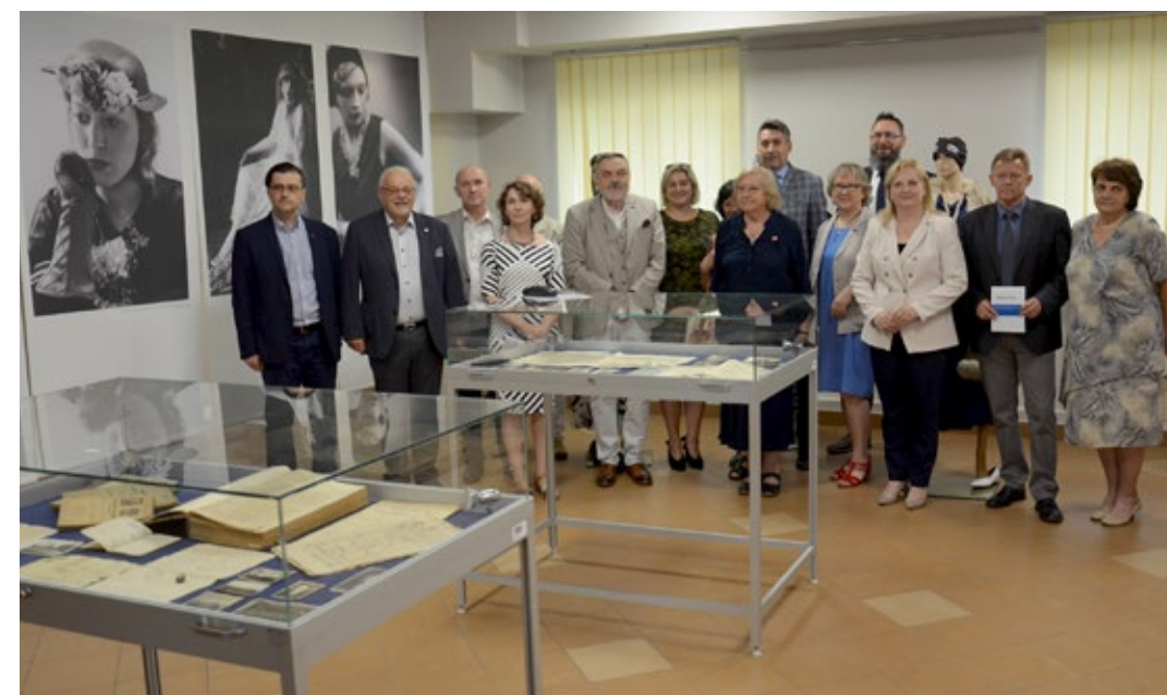
36. Zdjęcie grupowe uczestników konferencji „Policjanci z lat 1918–1956 w źródłach archiwalnych i wspomnieniach”