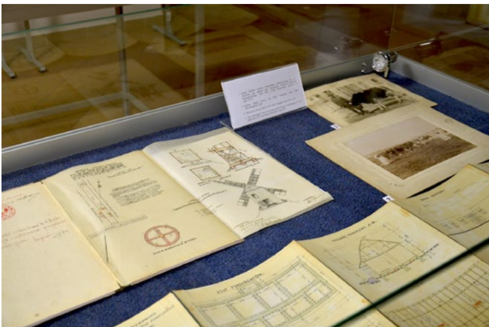
7-8. Spotkaniu towarzyszyła dodatkowo wystawa przygotowana przez Konrada Maja, dostępna on-line na stronie Archiwum Państwowego w Kielcach

„Trzecie Powstanie Śląskie w źródle archiwalnym”, Kielce, 26 maja 2021 roku