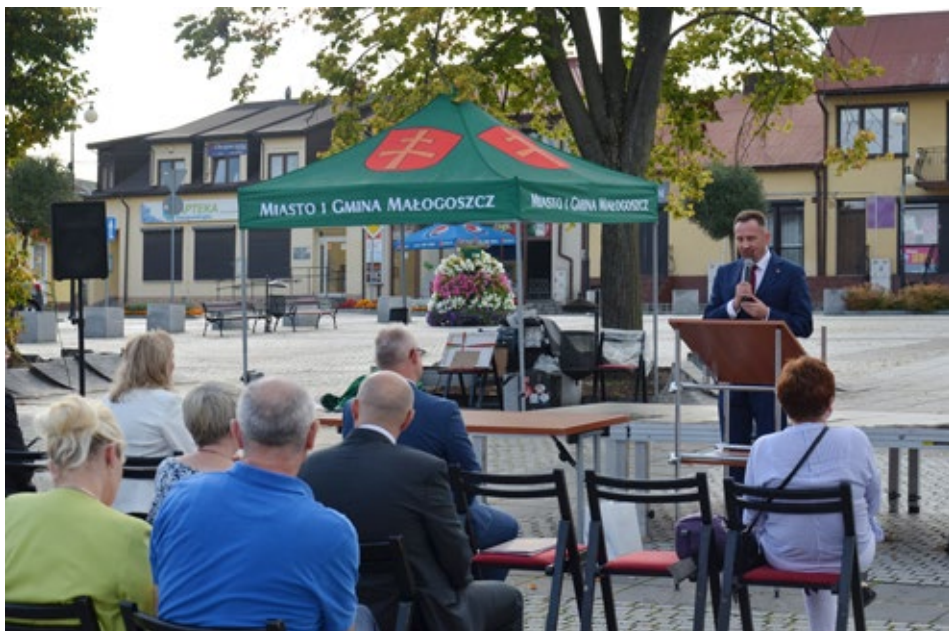
4. Paweł Faryna Starosta Jędrzejowski przywitał obecnych gości w imieniu władz powiatowych