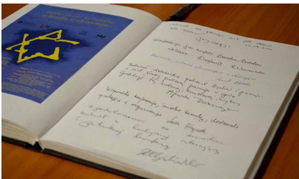
51. Wpisy w księdze pamiątkowej