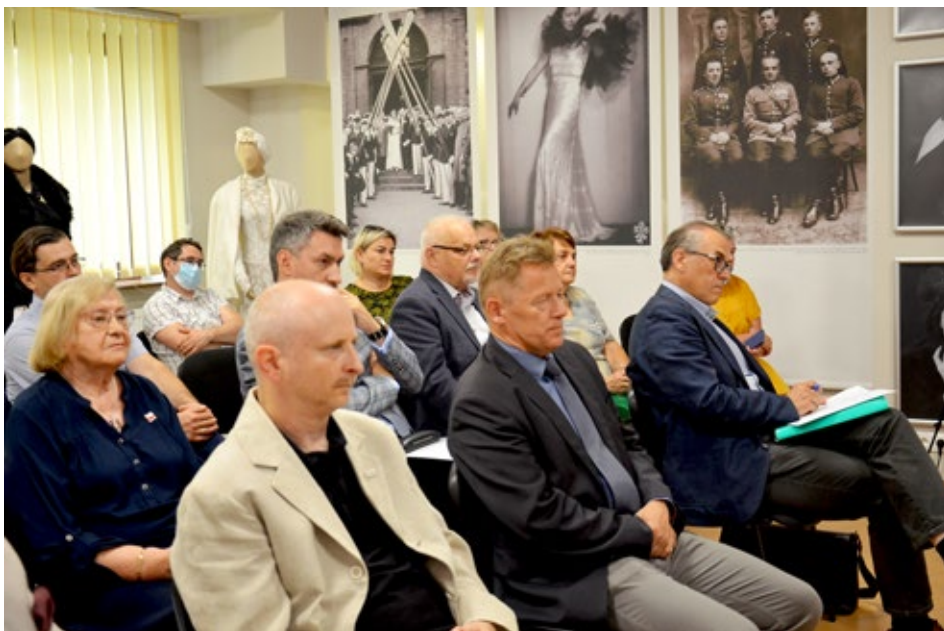
33. Uczestnicy spotkania