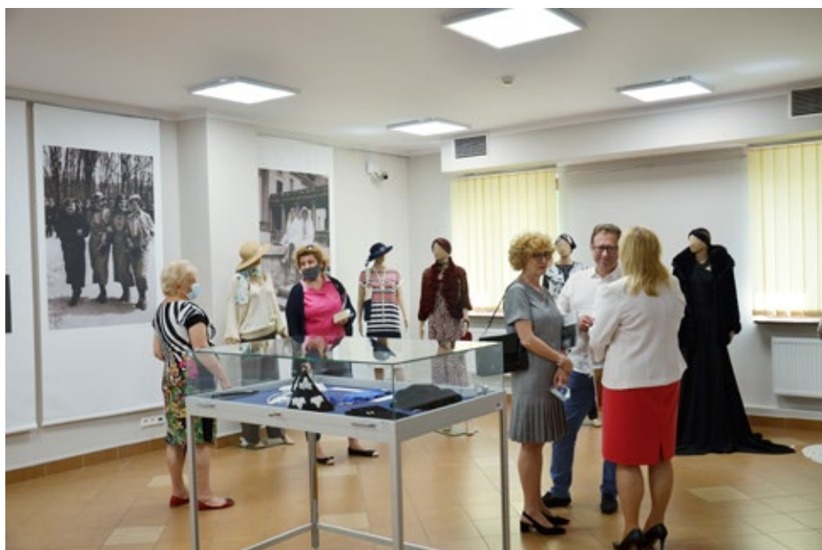
3. Międzynarodowy Dzień Archiwów Państwowych wpisał się także w Europejskie Dni Dziedzictwa