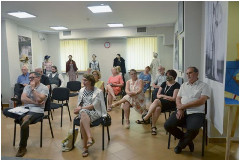
42. Prelegenci oraz goście podczas obrad