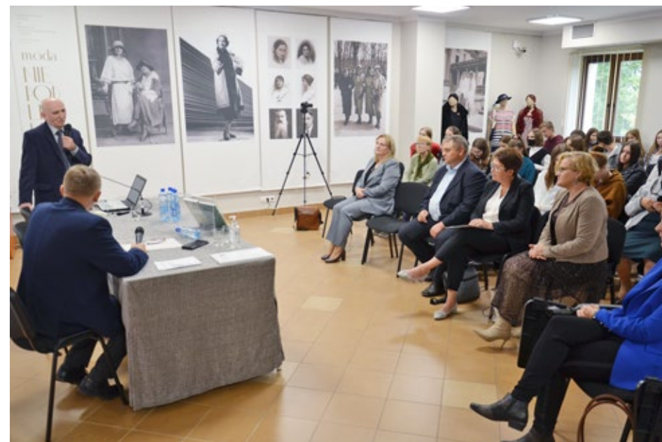
60. Zgromadzeni goście podczas dyskusji