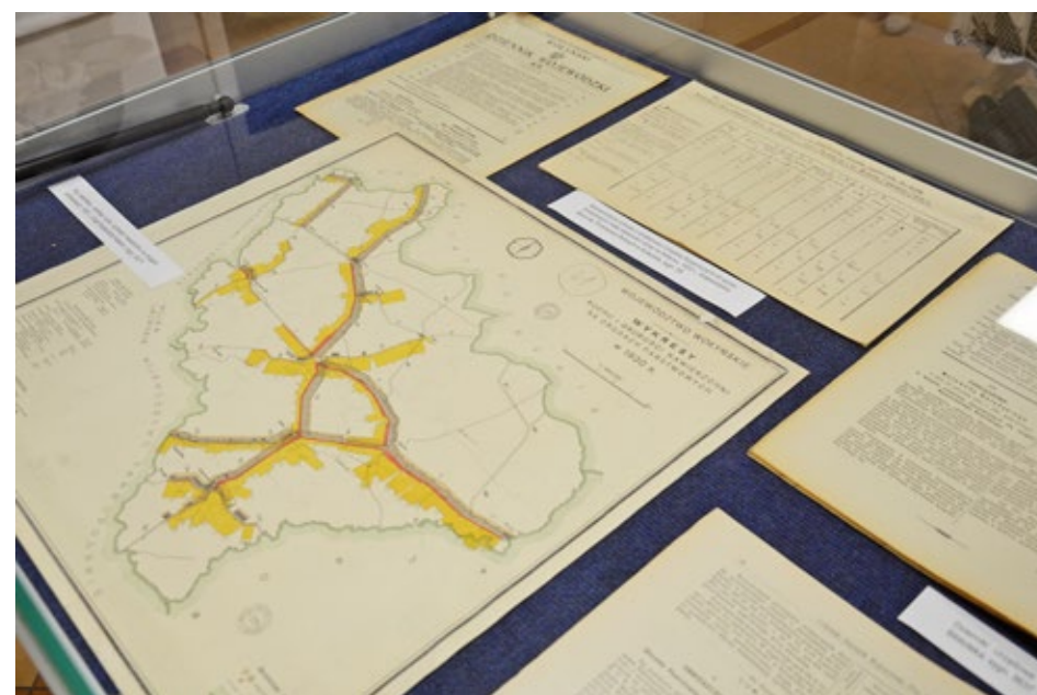
61. Wystawa: „Wybrane materiały dotyczące Wołynia z zasobu Archiwum Państwowego w Kielcach”