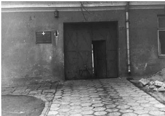
Widok na areszt w Opatowie, AIPN, Karna pomoc prawna. Richard Hospodarsch – funkcjonariusz SD w Opatowie sygn. IPN BU 3077/108, fot. 20 (brak daty)