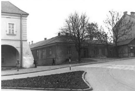
Areszt w Opatowie, AIPN, Karna pomoc prawna. Richard Hospodarsch – funkcjonariusz SD w Opatowie, sygn. IPN BU 3077/108 fot. 19 (brak daty)