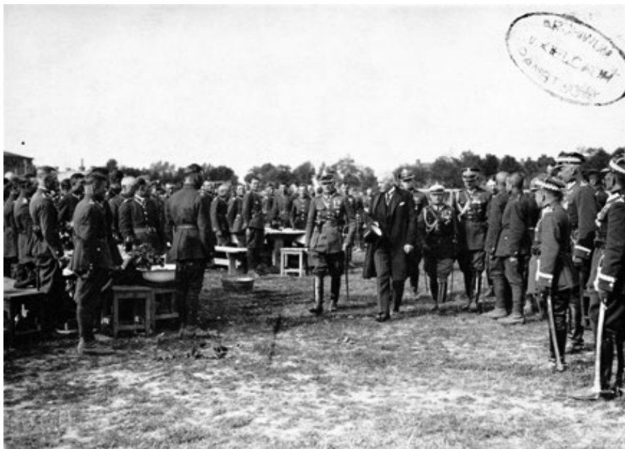
7. Prezydent Ignacy Mościcki wśród kadry oficerskiej i żołnierzy 2 PAL Legionów, 1933 r., w Zbiorze fotografii, sygn. 73.