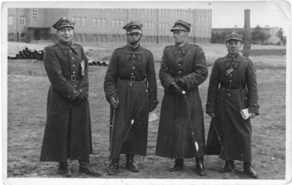
10. Oficerowie 2. Pułku Artylerii Lekkiej Legionów przed budynkiem koszar na Stadionie, bd., sygn. 2.