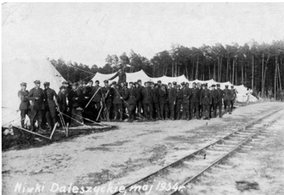
8. Manewry w Niwkach Daleszyckich, 1934 r. Zbiór Januariusza Glibowskiego, antykwariusza z Kielc, sygn. 594.